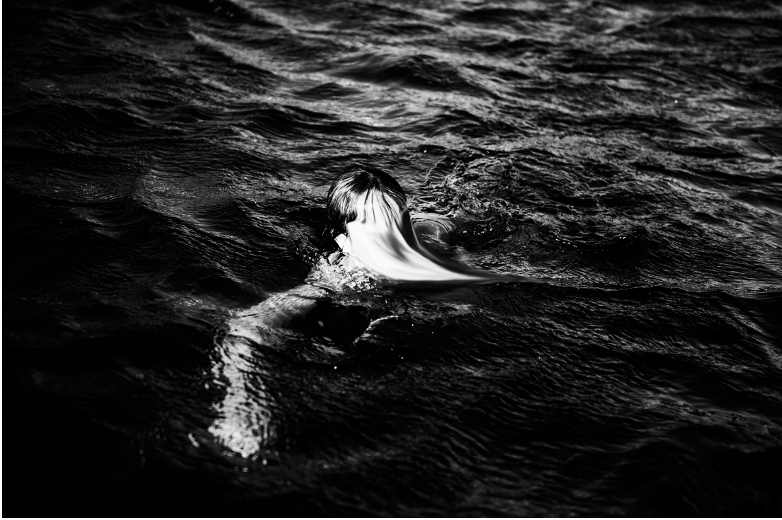
When I Cry